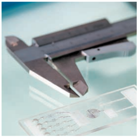
Physio Check - passives Lab-on-a-chip System für die Diagnostik

Die Mikrosystemtechnik ist eine Querschnittstechnologie, in deren Mittelpunkt die Miniaturisierung technischer Komponenten und Geräte steht.