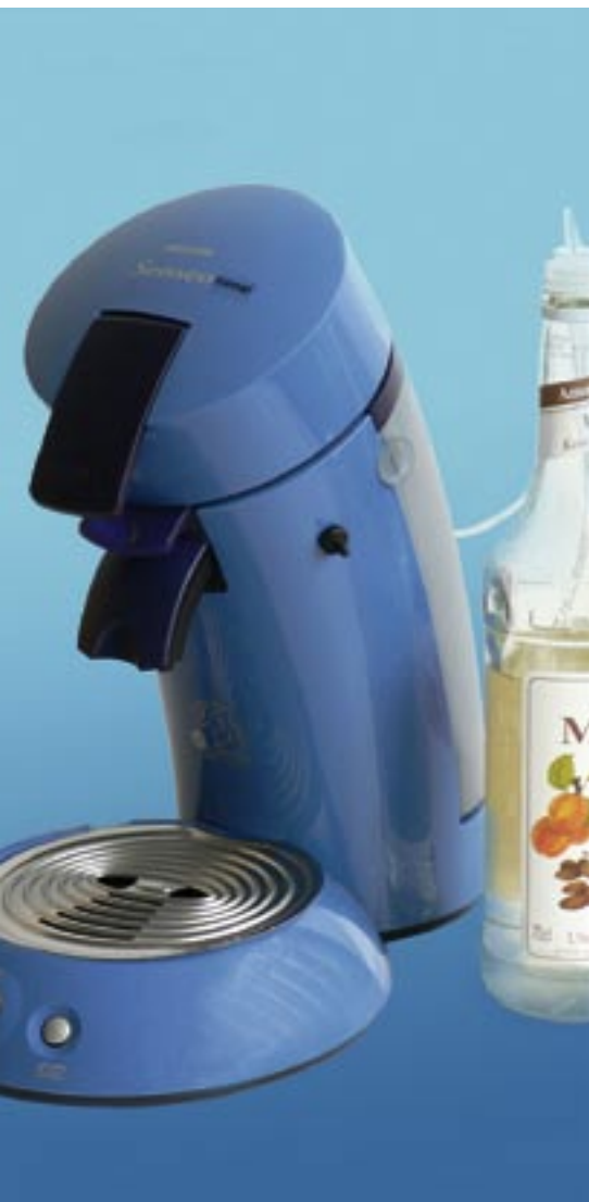
Prototyp einer Kaffeemaschine mit Förderung eines Geschmackstoffs auf Knopfdruck.

Denkbare Applikationen sind ähnlich zahlreich wie die Produkte der Konsumgüterindustrie. Kaffeemaschinen und Getränkespender werden mithilfe von Mikrotechnik mit aromatischen Zusätzen oder Süßstoffen versehen. Bügeleisen werden in ihrer Funktionalität verbessert, indem Pumpen für einen höheren Dampfdruck sorgen oder Bügelhilfsstoffe und Duftstoffe ausbringen. Waschmaschinen müssen nicht mehr manuell mit Weichspülern und Waschmitteln – in Abhängigkeit vom Waschprogramm – befüllt werden, sondern entnehmen programmgesteuert aus neben der Maschine platzierten Reservoirs die notwendigen Flüssigkeiten. Kosmetika und Cremes werden in definierten Dosiermengen ausgebracht, wodurch ein einfaches, sauberes Handling gewährleistet ist. „Intelligente Nasen“ registrieren den Status eines Backvorganges. Diese Sensoren müssen aktiv mit der Luft aus dem Backofen versorgt werden, dürfen sich allerdings nicht selbst in der heißen Atmosphäre befinden. Eine Mikropumpe versorgt den Sensor mit dem „Backgas“.