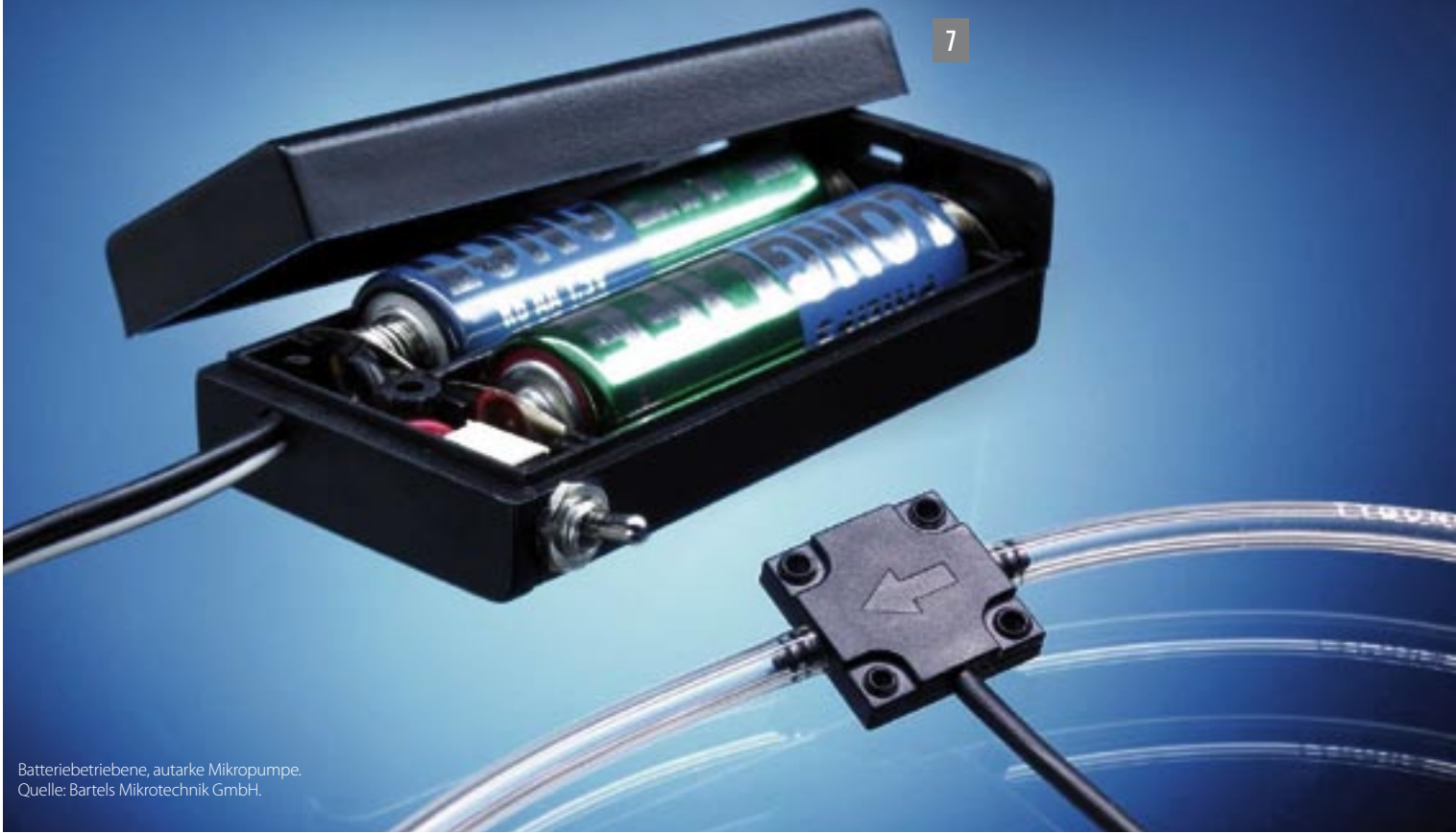
Batteriebetriebene, autarke Mikropumpe.